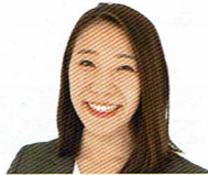
くろす なるみ 黒須 成美氏

マラソンランナー/ スポーツコメンテーター 1996年アトランタオリンピック 10000m 5位