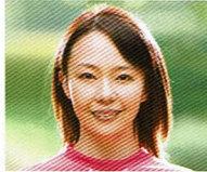
ちば まさこ 千葉 真子氏

マラソンランナー/ スポーツコメンテーター 1996年アトランタオリンピック 10000m 5位