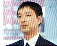
たにがま ひろのり 谷釜 尋徳氏

パラ陸上競技選手 東京電力ホールディングス株式会社 2016年リオデジャネイロパラリン ピック 男子4×100mリレー(T42-47) 銅メダル